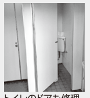
トイレのドアも修理、使用できます