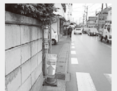
南柏に向かって右側歩道も待機場所もなく危険と指摘され、事故も起きています