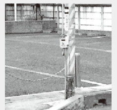
南柏にに向かって左側は歩道がある